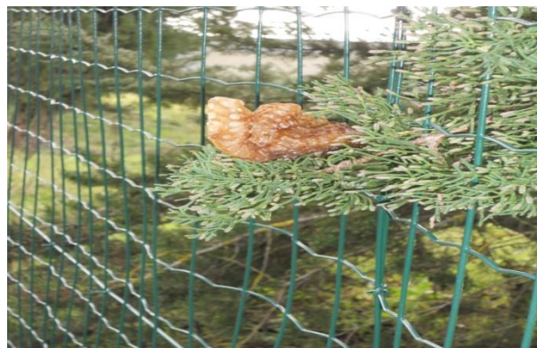
FAVO DI APE