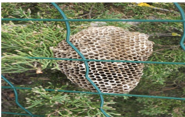
FAVO DI VESPA