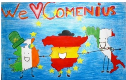
Il logo proposto dalla Spagna