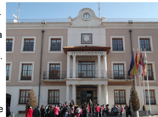
Il municipio di Socuellamos

Dal primo al 5 Febbraio una delegazione di insegnanti delle scuole primarie di Rignano, Incisa e Troghi ha partecipato al primo incontro di progetto che si è tenuto a Socuellamos. E' stata l'occasione per visitare la scuola spagnola e il territorio circostante, conoscere i colleghi delle altre nazioni coinvolte nel progetto, presentare il lavoro fatto nelle nostre scuole e progettare l'attività futura.