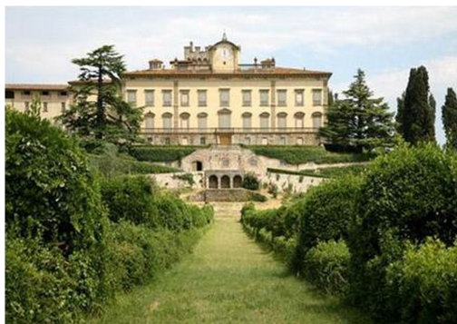
Alcune immagini del nostro territorio

Alcune classi cominceranno anche a lavorare su canti e danze tradizionali , argomento del prossimo anno scolastico.