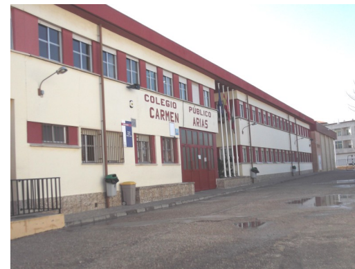
La scuola Carmen Arias

E' una scuola pubblica, si trova nel paese di Socuellamos, nella regione di Castilla – La Mancha, a 180 km da Madrid e a 140 circa da Toledo.