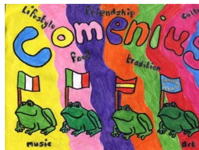
Il logo proposto dall'Irlanda

Come prima attività tutti i ragazzi delle scuole coinvolte hanno disegnato un logo del progetto. Ogni nazione ha selezionato una proposta. I tre disegni verranno poi uniti in un unico simbolo.