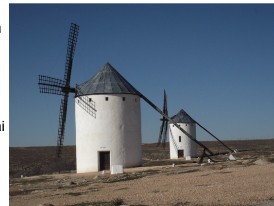
I mulini a vento del vicino paese di Criptana

Da tre a sei anni i bambini frequentano la scuola dell'infanzia e dai 6 ai 12 anni la scuola primaria, con classi dalla prima alla sesta. L'orario delle lezioni è dal lunedì al venerdì dalle 9 alle 14, non c'è mensa. Gli insegnanti sono assegnati ai bienni (prima-seconda, terza-quarta, quinta-sesta), perciò ogni classe cambia insegnanti tre volte nell'arco della scuola primaria.